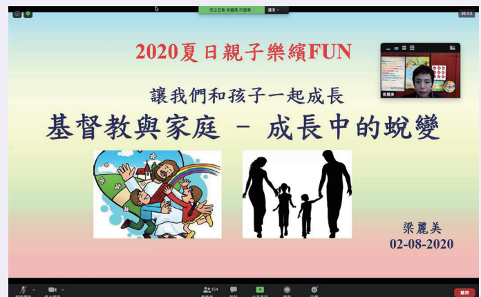
▲ 2020 網上夏日親子樂續 FUN 家長講座及分享